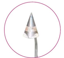
spot halogène adapté