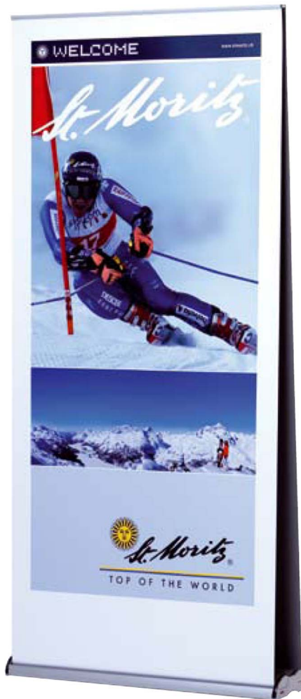
également disponible en version double pour visuels en recto verso