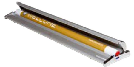
Visuel ou cassette interchangeable